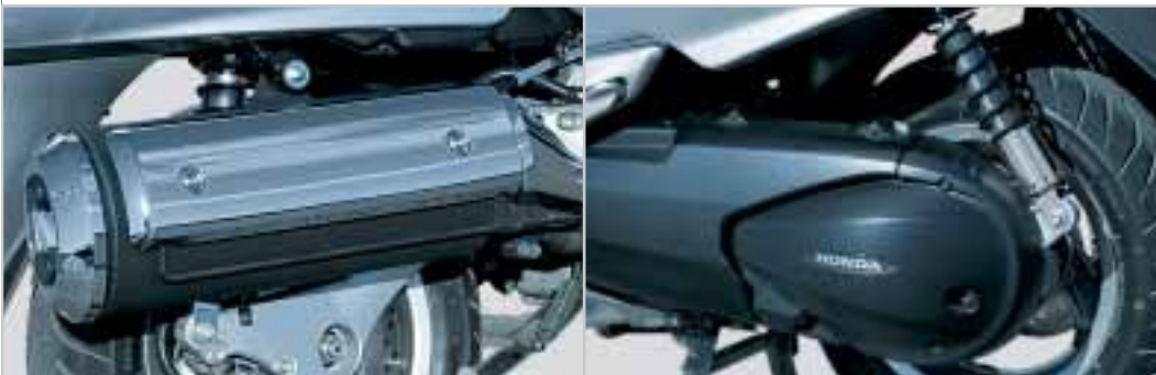
Der großvolumige, ovale Edelstahlschalldämpfer mit eleganter Chromabdeckung minimiert den Geräuschpegel.

Komfortables und entspanntes Touren zu zweit: auf einer breiten und gut gepolsterten, geteilten Doppelsitzbank mit ergonomisch geformten Rückenlehnen. Unter der Sitzbank finden Sie genügend Platz, um viele Dinge zu verstauen. Und mit dem 16-Liter-Kraftstofftank – einem der größten in der Rollerklasse – haben Sie Spielraum für weite Touren durch Raum und Zeit. Dabei sorgt die Honda-Wegfahrsperre (H.I.S.S.) dafür, dass der Luxus-Roller ausschließlich für Sie Zeit hat.